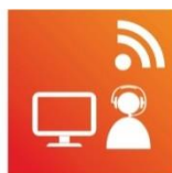
Communication & Management